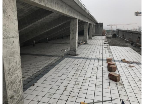
学生宿舍三组团 2#楼屋面防滑地砖铺设 (2017. 3. 18)