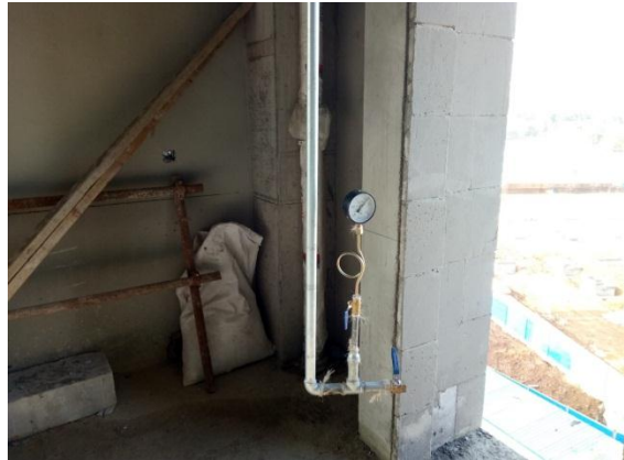
科教楼二5层喷淋试压 (2017. 3. 16)