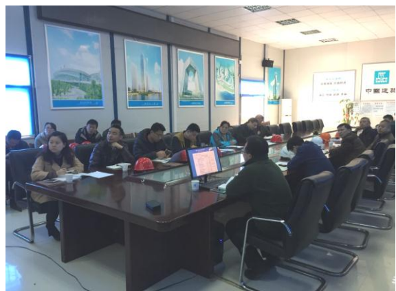
学生宿舍一组团完工移交汇报 (2017. 3. 16)