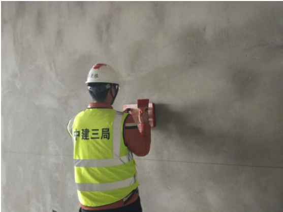
公教楼二抹灰实测数据上墙 (2017. 3. 15)