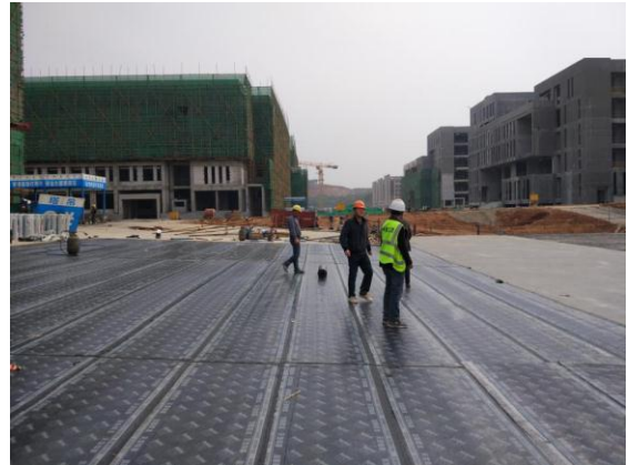
校前区地下室顶板防水卷材施工 (2017. 3. 16)