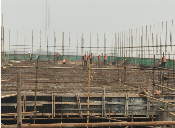
大学生活动中心 A 区二层竖向 三层水平梁板结构施工 (2017. 3. 18)