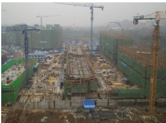
学生宿舍二组团施工全景 (2017. 3. 16)