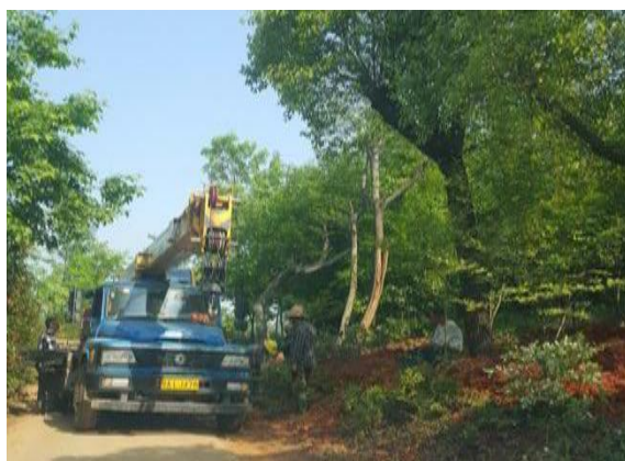
梨豹路上树木迁移 (2016. 4. 30)