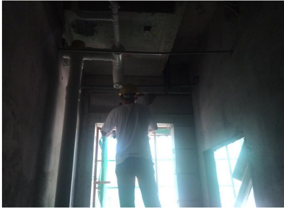
学生宿舍一组团 4#楼 1层 管道施工 (2016. 5. 3)