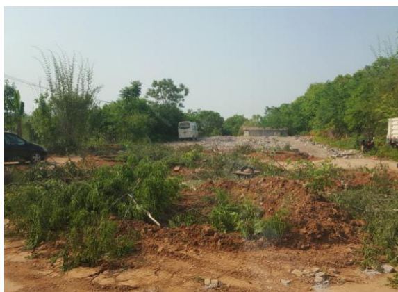
梨豹路上房屋拆除 (2016. 4. 30)