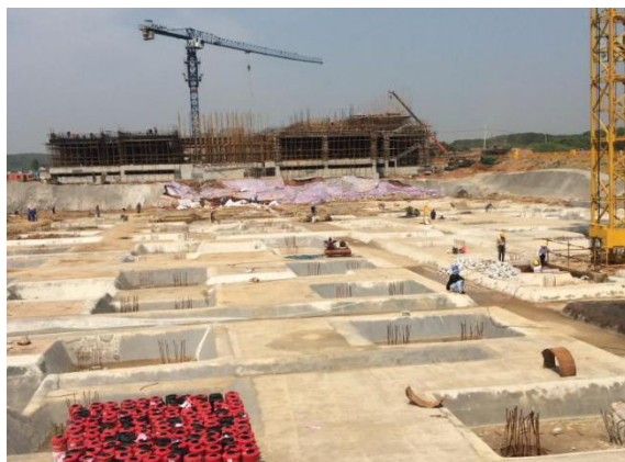
公教二人工清底、斜坡垫层施工 (2016. 4. 29)