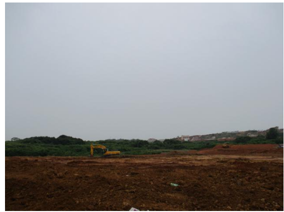
学生宿舍三组团东侧道路基础压实。 (2016. 5. 4)