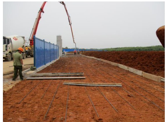
环一路侧主道路浇筑。 (2016. 5. 4)