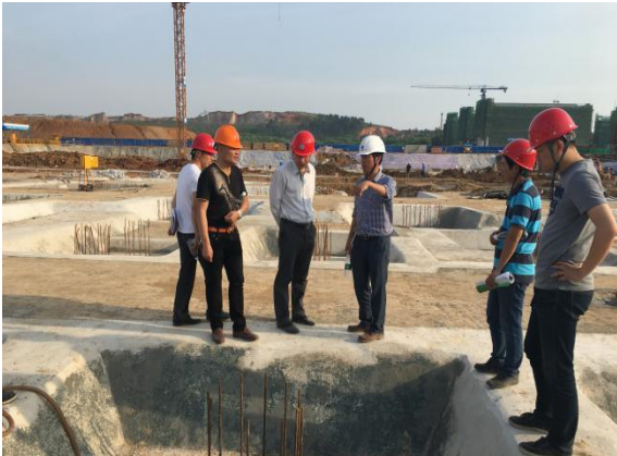
核心科教区域 22m 范围内部分桩基验收 (2016. 4. 29)