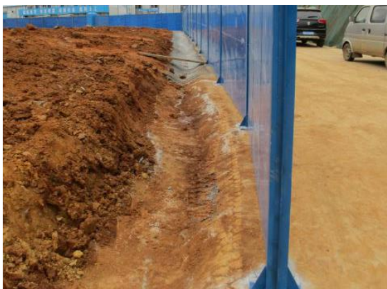
学生宿舍三组团西侧围挡安装及排水沟开挖。 (2016. 5. 4)