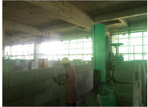
学生宿舍一组团 2#楼 2层 砌体施工 (2016. 5. 3)