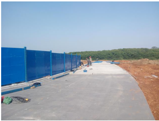
学生宿舍三组团北侧围挡安装。 (2016. 5. 3)