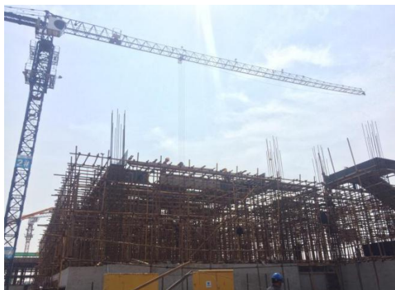
科教楼三一层模板架体施工 (2016. 4. 29)