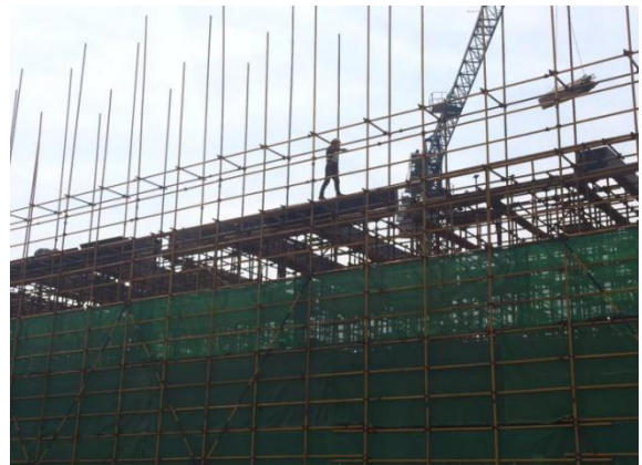
科教二北侧外脚手架搭设 (2016. 4. 29)