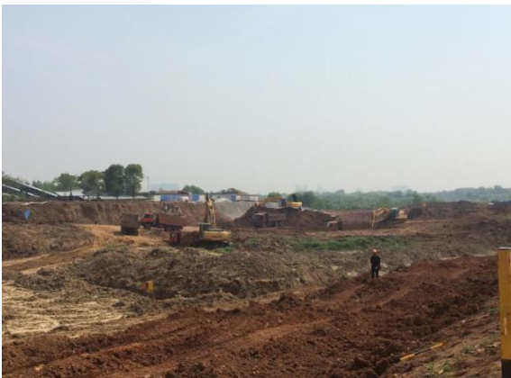
教学服务中心环路施工、清淤换填 (2016. 4. 29)