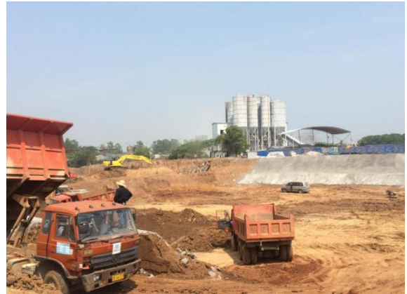
科教楼一土方开挖 (2016. 4. 29)