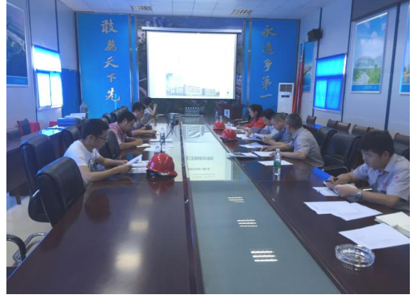
学生宿舍一组团2、5#楼主体结构分部工程验收 (2016. 4. 29)