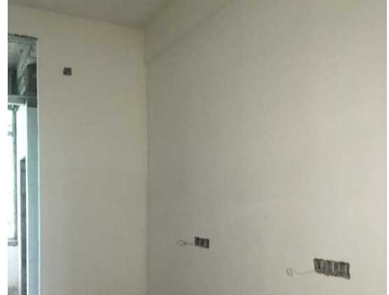
学生宿舍一组团室内腻子施工第一遍（134#楼已至 4 层） (2016. 5. 31)