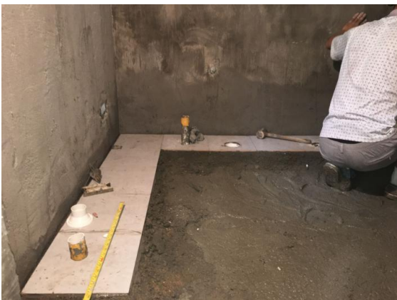
学生宿舍一组团 4#楼一层无障碍居室卫生间地砖铺贴 (2016. 5. 31)