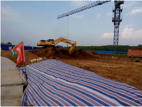
学生宿舍三组团 2#塔吊安装。 (2016. 5. 31)