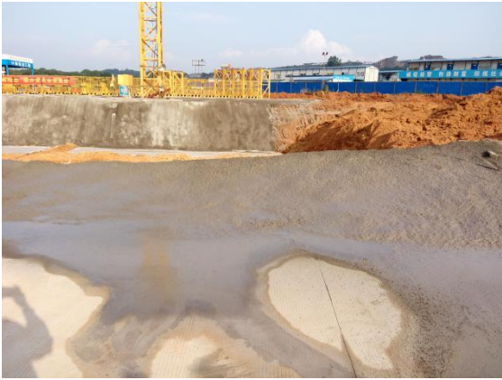
学生宿舍三组团 1#宿舍楼基坑喷锚。 (2016. 5. 31)