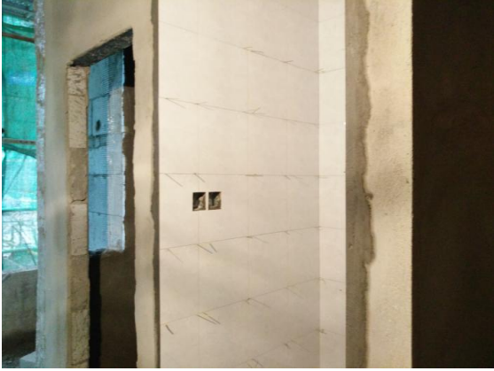
学生宿舍一组团 1#楼一层洗漱间墙面砖铺贴（3#楼同步） (2016. 5. 31)