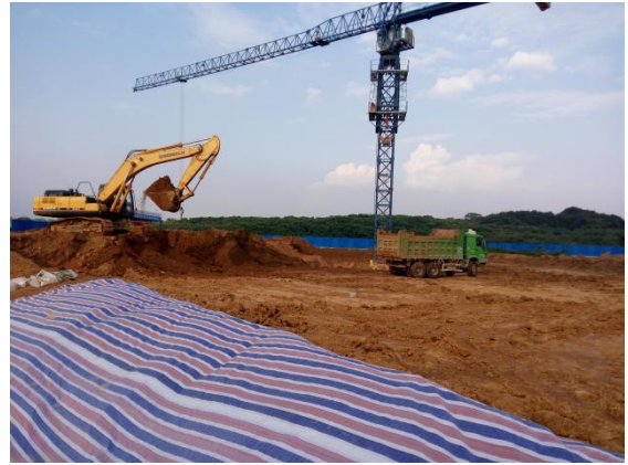
学生宿舍三组团 2#宿舍楼基础开挖。 (2016. 5. 31)