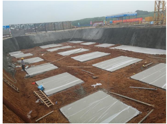
学生宿舍三组团 1#宿舍楼基础垫层浇筑。 (2016. 5. 31)