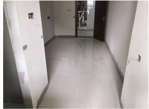
学生宿舍三组团 1-4#楼双人间地砖铺贴 (2017.3.13)