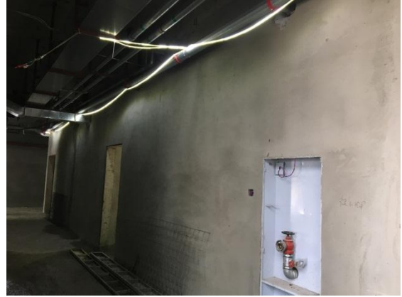
科教楼一抹灰施工 (2017. 3. 14)