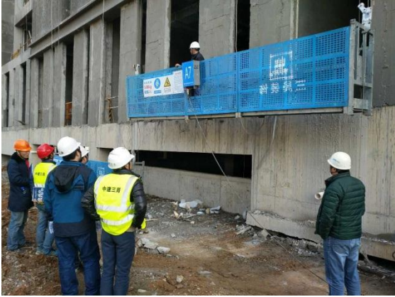
科教楼二北面吊篮验收 (2017. 3. 12)