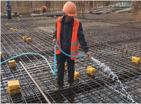
科五首层结构模板冲洗 (2017. 3. 15)