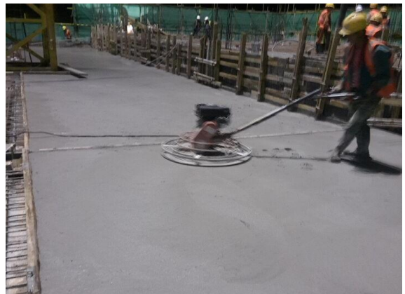
五标段 5-2#楼地下室顶板施工 (2017. 3. 15)