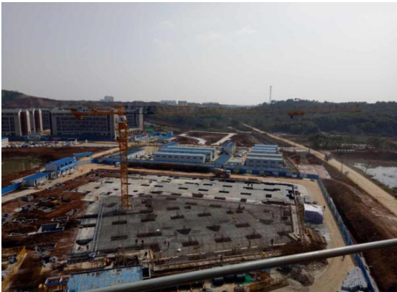
科教楼四施工全景 (2017. 03. 15)