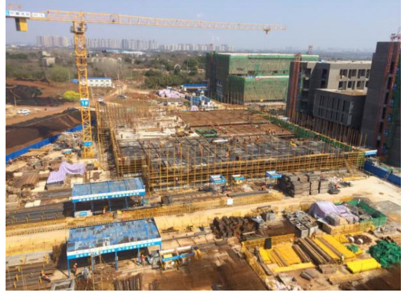
科教楼五施工全景 (2017. 03. 15)