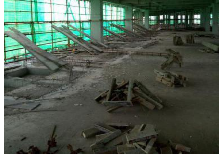
学生宿舍一组团项目 5#楼 4 层反坎施工 (2016.4.9)