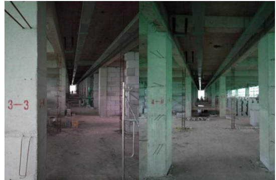
学生宿舍一组团 3、4#楼六层砌体施工 (2016.4.4)