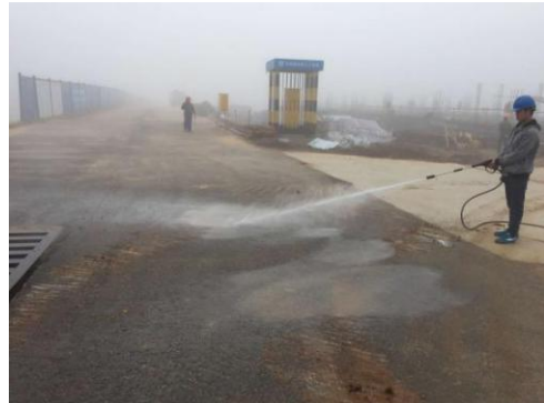
核心科教区项目冲洗设备使用 (2016.4.7)