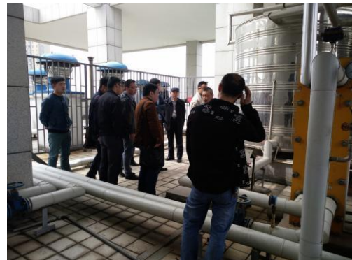
建设、监理、施工单位相关人员至五星太阳能厂家 已完工程项目进行实地考察 (2016.4.7)