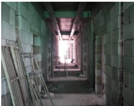
学生宿舍一组团 1#楼六层砌体施工 (2016.4.9)