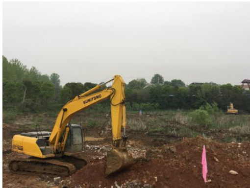
校前区项目教学服务中心清淤换填 (2016.4.9)