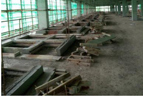
学生宿舍一组团项目 2#楼 3 层反坎施工 (2016.4.9)