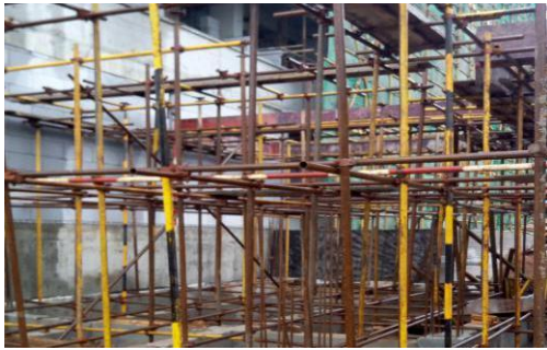
学生宿舍一组团 1#附属楼满堂架施工 (2016.4.3)