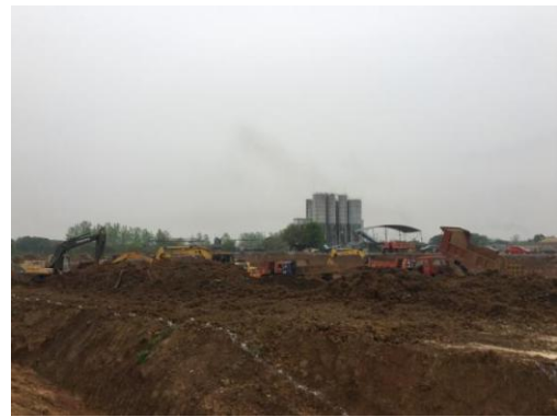
校前区项目科教一土方开挖 (2016.4.9)