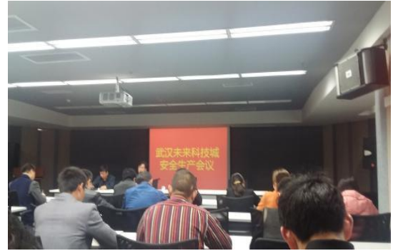
参加未来科技城安全生产会议 (2016.4.1)