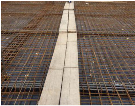
核心科教区项目科教二混凝土浇筑马道搭设 (2016.4.7)