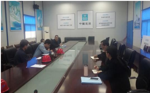
召开二标段边坡防护专题会议 (2016.4.5)